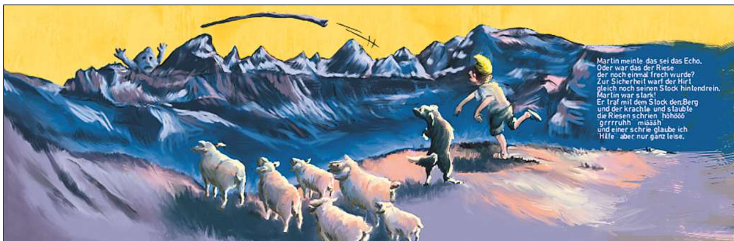
Illustration der Sage vom Martinsloch.